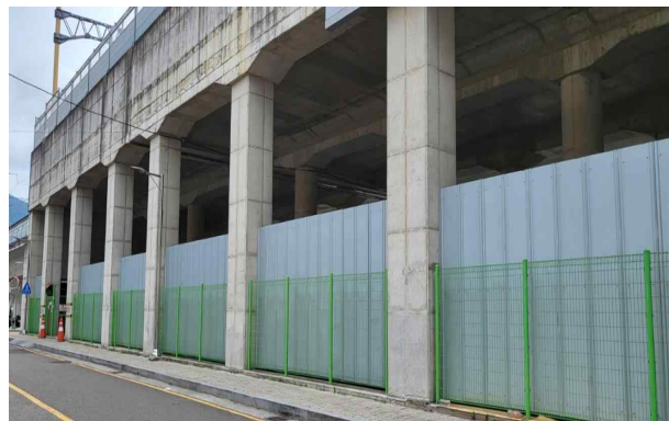
▲ 동해선 안락역 하부공간 현장사진(외부)